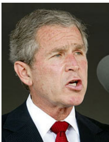
President George Bush hade givit Östtimor respit att godkänna avtalet

Med anledning av Svenska Freds- och Skiljedomsföreningens kampanj för den internationella brottmålsdomstolen skickade Östtimorkommittén den 23 oktober nedanstående brev till Östtimors premiärminister Mari Alkatiri och utrikesminister José Ramos Horta.