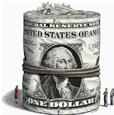
Regeringen beslöt i somras att bevilja Östtimor budgetstöd på tio miljoner kronor

FN-organen ansvarar för koordinationen av biståndet till Östtimor, vilket är en svår uppgift. Sverige koordinerar vanligtvis sitt bistånd med det som övriga nordiska länder ger. Uppgiften underlättas av att länderna har ambassader i samma hus i Jakarta. Överlappningar av biståndet är dock svåra att undvika.