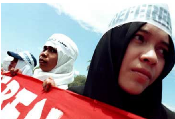
Kvinnor protesterar i Aceh 2001

Oklarhet rådde beträffande antalet civila dödsoffer, men en oberoende uppskattning i november angav 300-400 personer. Till följd av de civila dödsoffren har olika aktionsgrupper, som verkar för freds- och miljöfrågor, samt kulturella organisationer i Indonesien protesterat mot våldet.