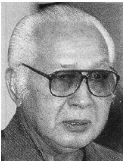
Soeharto var makten i Indonesien 1967-1998

Befolkningmässigt är Indonesien ett av världens folkrikaste länder med 220 miljoner invånare, varav mellan 80 och 90% är muslimer.