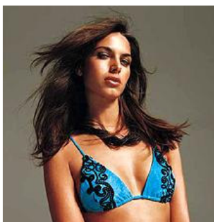
Det blev heta diskussionerna i vårt hus om att använda bikini på stranden.

Mina altruistiska insatser i Östtimor blev inte av den karaktär jag föreställt mig när jag full av nit anlände till Dilis dammiga flygplats. Istället för en handräckning på timoresiska barnhem eller gräsrotsarbete i lokala föreningar finner jag mig strax i färd med att trösta diplomater som dumpats av portugisiska FN-soldater, eller att uppmuntra diplomater att dumpa portugisiska FN-soldater.