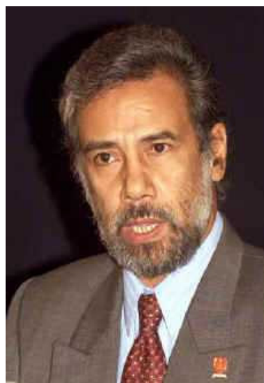
President Xanana Gusmão näst populärast

Dilis före biskop, fredspristagaren Carlos Ximenes Belo, är landets mest populära person. Andra plats delas av president Xanana Gusmão och biskop Basilio do Nascimento. På tredje plats kommer utrikesminister José Ramos-Horta följd av överbefälhavaren Taur Matan Ruak och socialdemokraternas ledare Mário Carrascalão och först efter denne kommer premiärminister Mari Alkatiri från Fretilin.