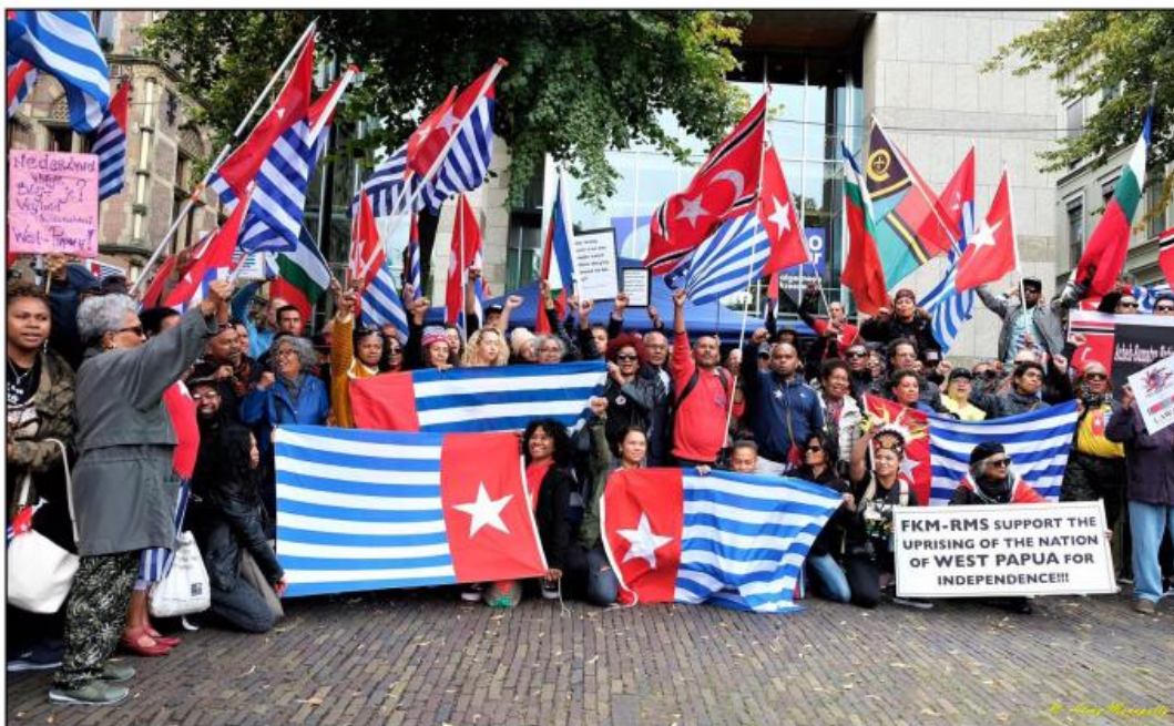
Demonstration i Haag, Nederländerna, den 6 september 2019

Kravet på en folkomröstning, som västpapuauer framför på offentliga möten och demonstrationer, är baserat på överenskommelsen som undertecknades